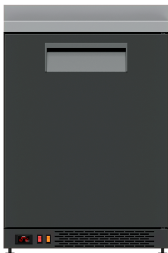
Стел барный TM101 (гладкая дверь и столешница с бортом)

Рекомендованная розничная цена: 70 700 руб.