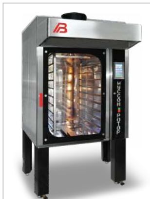
Печь «Муссон-ротатор» модель 33 на опорах