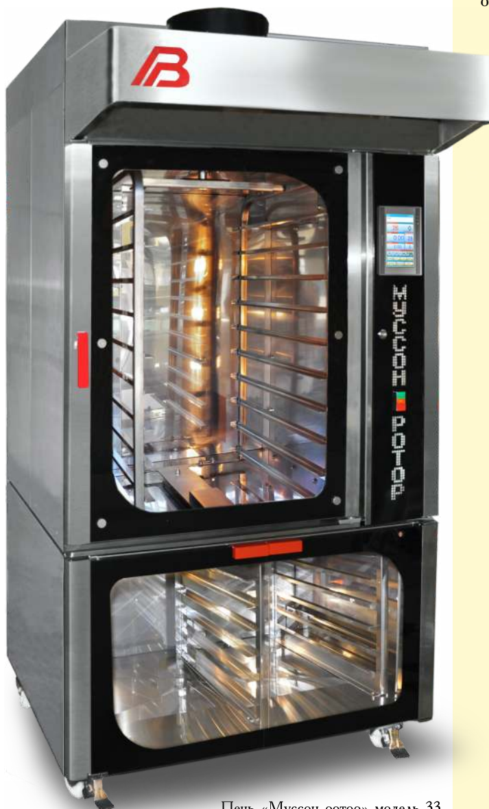
Печь «Муссон-ротатор» модель 33 и расстойный шкаф «Бриз» модель 33