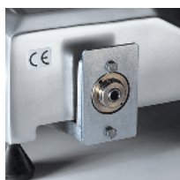
Device for releasing the carriage