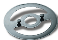
Blade removal tool