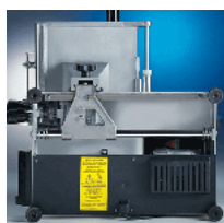
Underside motor protection plate